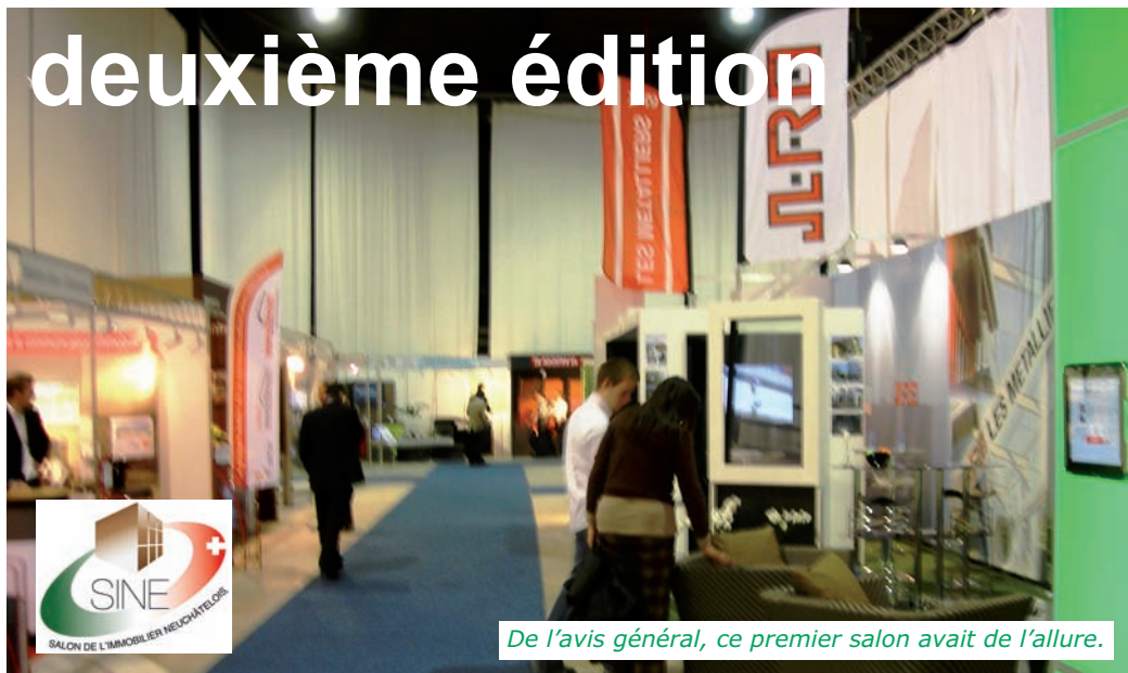
De l'avis général, ce premier salon avait de l'allure.

Présenté dans cette publication en mars dernier, le stand de la CIN, partagé avec l'USPI, avait fait l'objet d'une réflexion pous-