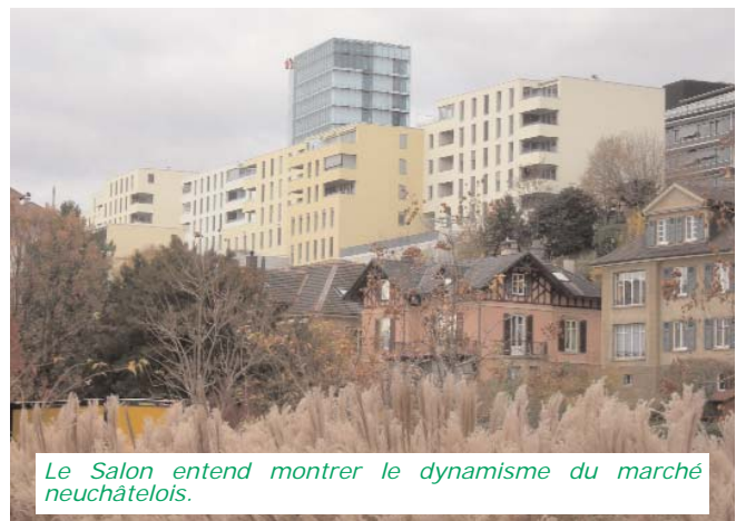
Le Salon entend montrer le dynamisme du marché neuchâtelois.

Interview : jean-luc.vautravers@cininfo.ch