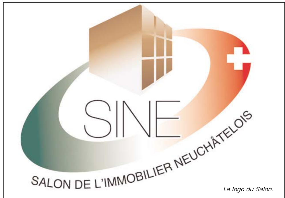
Le logo du Salon.

- Nous souhaitons que le Salon se caractérise par une vie animée, à laquelle contribueront de nombreuses animations. Dans la salle de curling, un salon