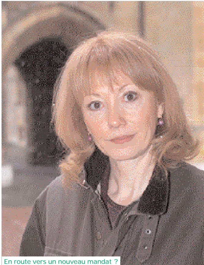
En route vers un nouveau mandat ?

«Certains, souligne-t-elle, ont considéré mes propos comme une manoeuvre politique, alors qu'il appartenait à ma responsabilité d'annoncer que nous allions tout droit dans le mur.»