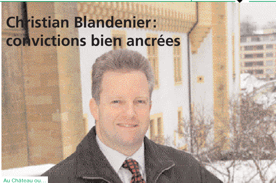
Au Château ou...

Cet avocat et notaire, domicilié à Chézard-Saint-Martin, a par ailleurs présidé aux destinées de la CIN, jusqu'en mai 2004.