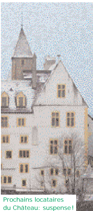
Prochains locataires du Château: suspense!

Elue il y a quatre ans sur, notamment, la promesse d'une réduction d'impôts, la directrice des finances explique qu'en août 2003, elle était déjà convaincue que l'Etat se dirigeait tout droit vers des difficultés de l'ordre de «100 millions». Mais, souligne-t-elle, en utilisant des euphémismes, «j'étais seule à le dire» et cette sonnette d'alarme n'a «pas été prise au sérieux par tout le monde».