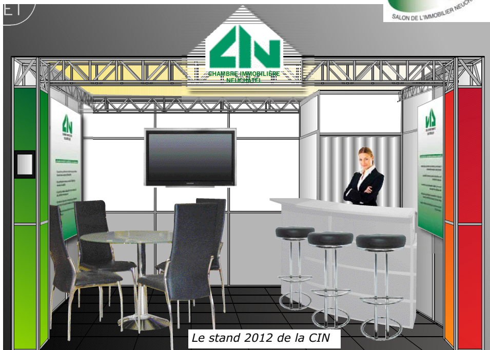
Le stand 2012 de la CIN

Changement d'adresse à communiquer à : Chambre immobilière neuchâteloise, case postale, 2001 Neuchâtel