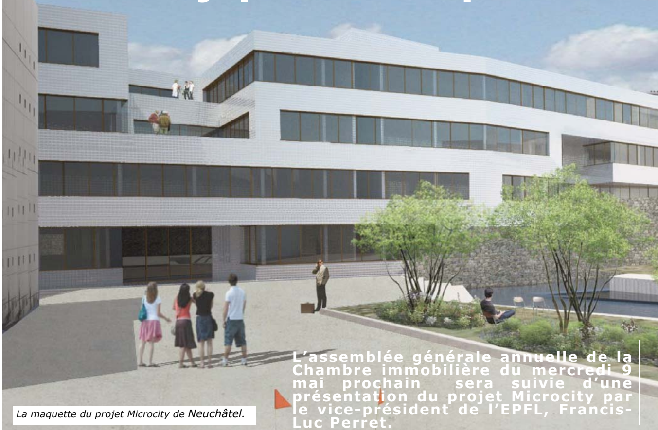
La maquette du projet Microcity de Neuchâtel.

L'assemblée générale annuelle de la Chambre immobilière du mercredi 9 mai prochain sera suivie d'une présentation du projet Microcity par le vice-président de l'EPFL, Francis-Luc Perret.